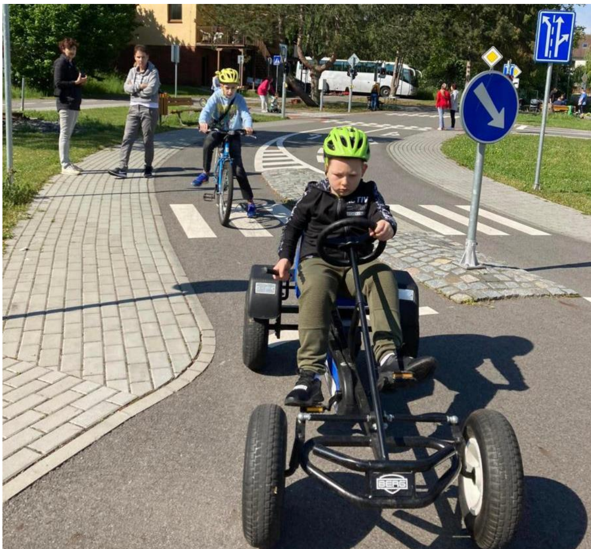
dopravní hřiště Malenovice