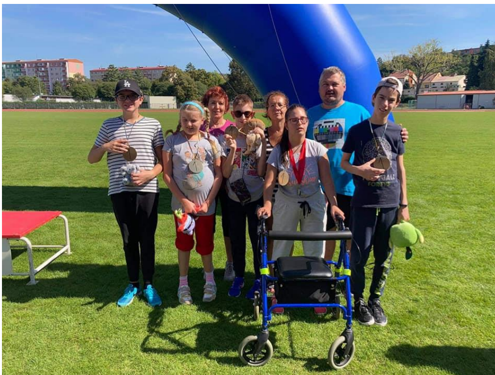
Olympiáda speciálních škol v Uherském Hradišti