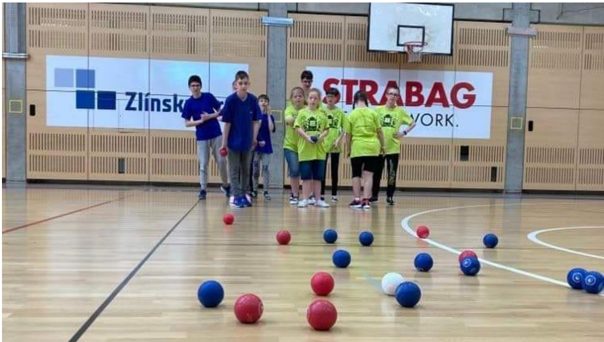
Turnaj speciálních škol v bocci