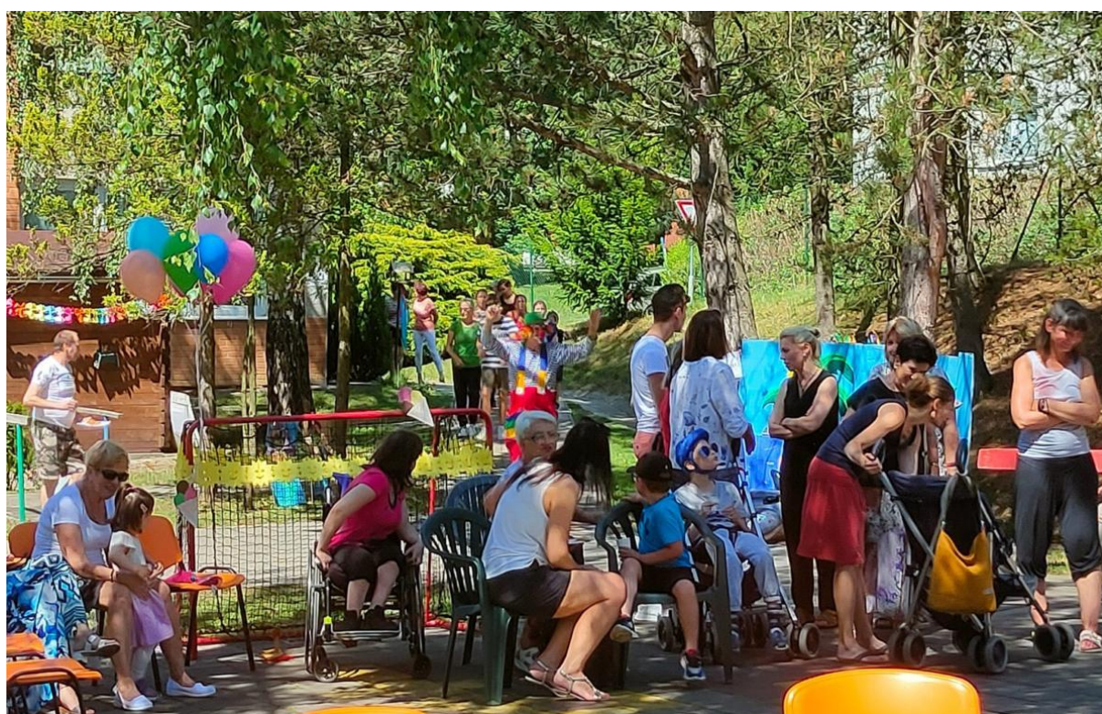
„Zahradní slavnost“ – 30. výročí založení naší školy