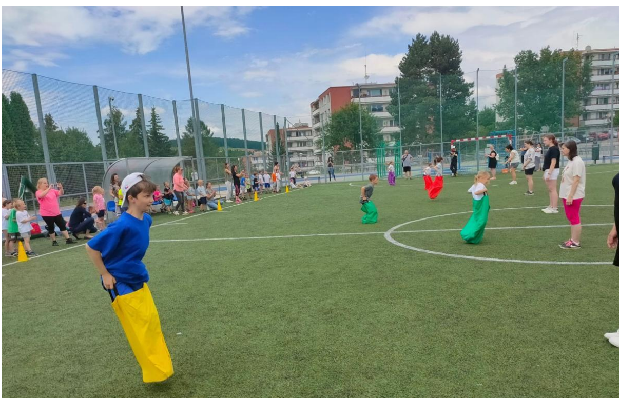
Sportáček – spolupráce s MŠ Dětská