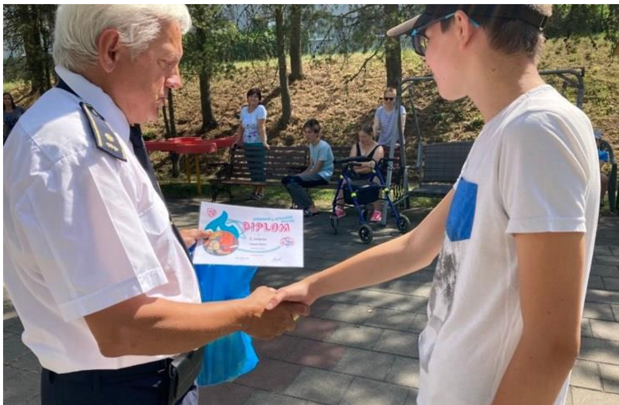
výtvarná soutěž „Pozární ochrana očima dětí“