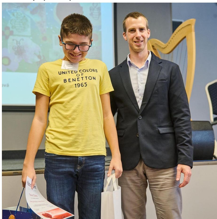
účast ve výtvarné soutěži „Radost tvořit 2021“