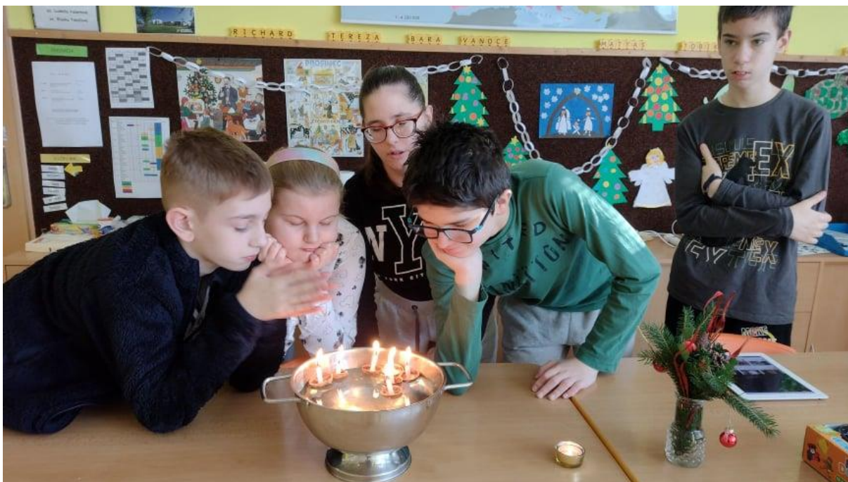
zvyky Vánoc ve třídách