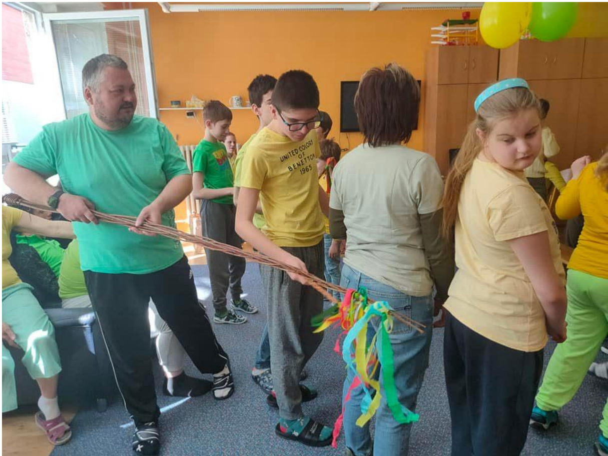
žluto – zelený den, slavíme Velikonoce